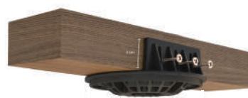
topo autonivelante para sarrafos