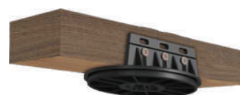
topo fixo para sarrafos